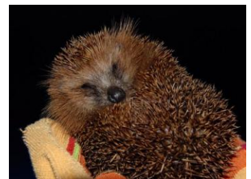
"De egel is de ambassadeur van de gemeente Woensdrecht. In het kader van het thema Biodiversiteit staan we stil bij het nu van de egel in de natuur. Een Kinderprogramma is er bij voldoende deelname"