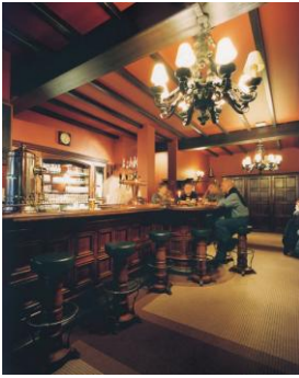
“BeVlogen Vrouwen ontmoeten in BV Café.”