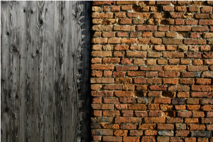
Ziel en Zakelijk op De Vijverhoeve

Bent u een leider, die een nieuwe stap gaat zetten in uw carrière? Of bent u een leider, die uw organisatie klaar wil maken voor de nieuwe economische uitdagingen in de komende jaren? Zakendoen met het hart is onderdeel van uw visie. Met aandacht voor het welzijn van uw medewerkers. Immers, het optimaal benutten van de talenten van uw medewerkers geeft als positief resultaat het succesvol inzetten van deskundigheid en creativiteit binnen uw onderneming.